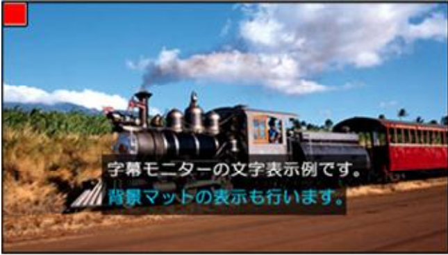
▲左上角がクリアパケット検出時のクリアマーカーです