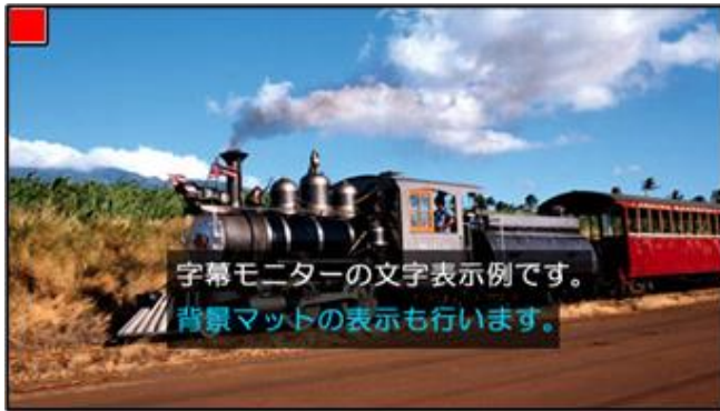
▲左上□がクリアパケット検出時のクリアマーカーです