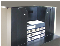
Sカセットホルダー装着イメージ