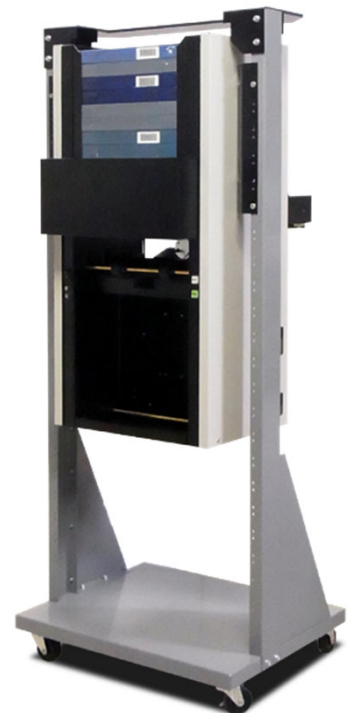
ローダーラック搭載イメージ